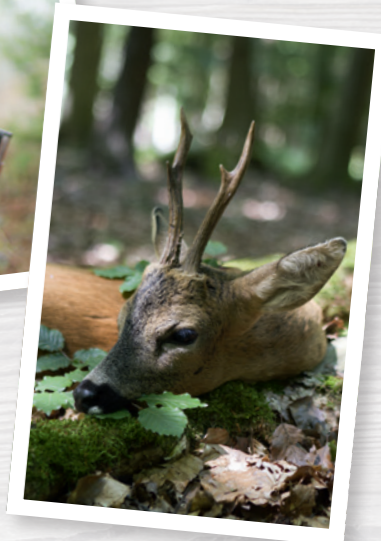
Das erlegte Wild sollte so schnell wie möglich versorgt werden.