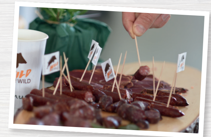
Die Vorschriften gewährleisten die hohe Qualität des Wildbrets.

Wer Wild bejagt, um Wildbret für den menschlichen Verzehr in den Verkehr zu bringen, muss ausreichend geschult sein, um das Wild vor Ort einer ersten Untersuchung unterziehen zu können – das ist die sogenannte „kundige Person“. Der DJV empfiehlt allen Jägern eine Schulung, insbesondere wenn längere Zeit kein Wild abgegeben wurde. Die Entnahme von Trichinenproben ist Pflicht beim Schwarzwild. Eine Schulung durch den Amtstierarzt ist Voraussetzung, wenn die Probe selbst entnommen wird.