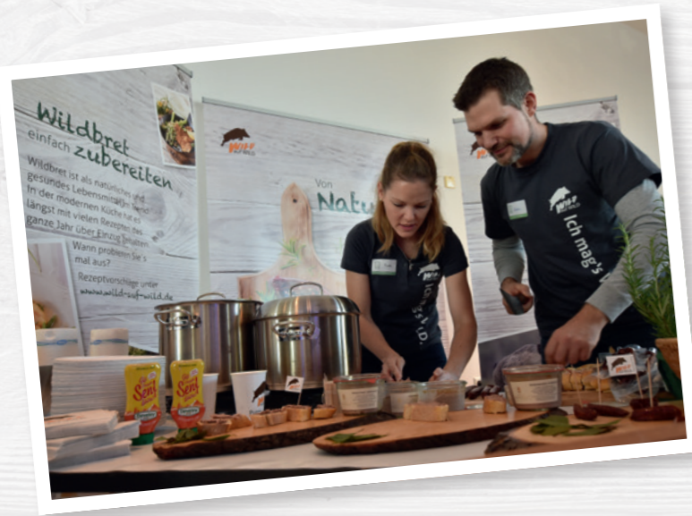
Je professioneller präsentiert, desto größer das Interesse

fotografieren, am besten während einer Aktion (zum Beispiel Jäger reicht einem Besucher eine Wildwurst). Ganz wichtig: Fragen Sie vorher, ob der- oder diejenige damit einverstanden ist, dass sein/ihr Foto und (voller!) Name in der Zeitung veröffentlicht werden. Kinder brauchen dafür die schriftliche Zustimmung ihrer Eltern.