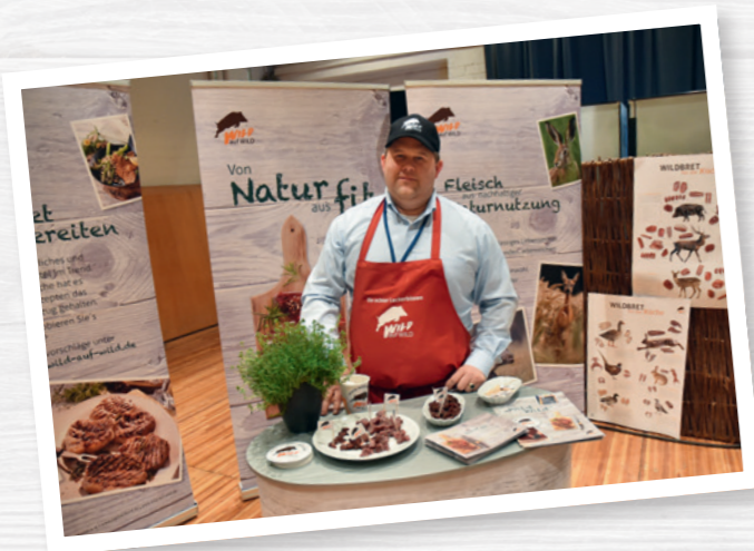
Für die Nutzung des Logos müssen die Lizenzbedingungen eingehalten werden.

Das moderne Aktionslogo „Wild auf Wild“ spricht Verbraucher an. Es ergänzt das Logo „Wild aus der Region“. Dieses steht für heimisches Wildbret von Jägern, Gaststätten und Metzgereien. Beide Logos werden auf Anfrage unter der E-Mail-Adresse info@djv-service.de von der DJV-Service GmbH zur Verfügung gestellt. Bitte beachten Sie die Lizenzbedingungen, die bei der Nutzung der Logos gelten: