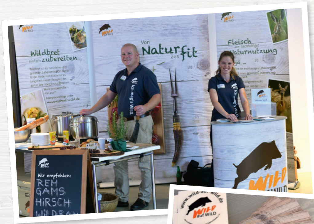
Die Werbemittel des DJV rücken das Thema Wildbret noch stärker in die Öffentlichkeit.