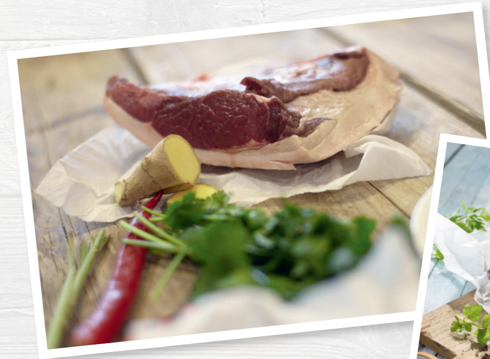
Lebensmittelhygiene spielt eine wichtige Rolle.

Grundsätzlich gilt: Bei Fragen sollte immer Ihr Gesundheits- bzw. Veterinär- und Lebensmittelüberwachungsamt vor Ort der erste Ansprechpartner sein. Die Mitarbeiter dort sind – genau wie Sie – daran interessiert, dass die Abgabe Ihrer Wildbretprodukte reibungslos und hygienisch vonstattengeht.