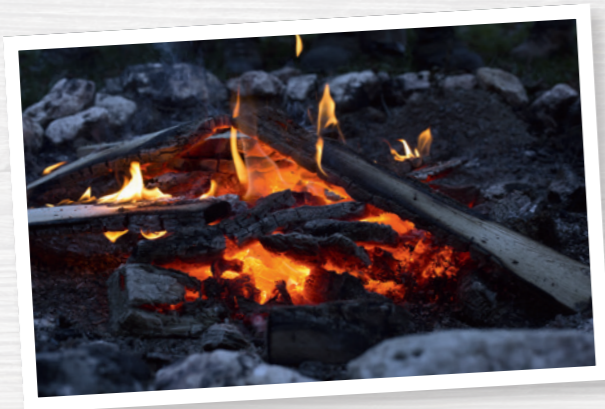
Ein Lagerfeuer sorgt für eine gemütliche Atmosphäre.

Die Einladung (A–D) mindestens zwei Wochen vor dem Veranstaltungstermin versenden und auch eine Wegeskizze beilegen. Die Einladung für A–C ca.