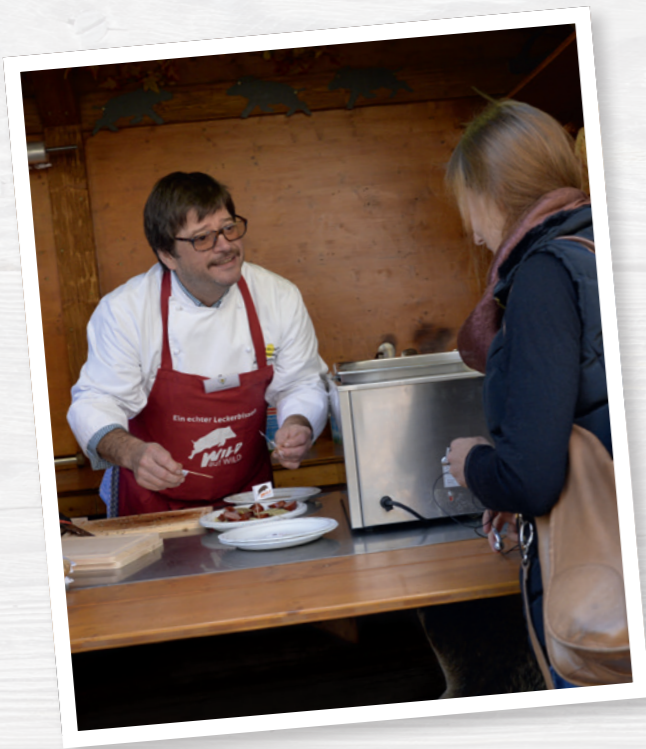
Alle Flächen sollten leicht zu reinigen sein.