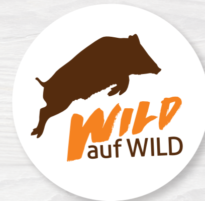
Das moderne Aktionslogo der Kampagne „Wild auf Wild“