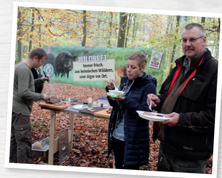
Regionales, frisch zubereitetes Wildbret – für viele Gäste sicher eine Premiere

In einer bereits durchgeführten Veranstaltung dieser Art haben wir eine Wildsuppe im Kessel auf dem Dreibein, eine Frischlingskeule im Dutch Oven und kurz gegrilltes Wildbret angeboten. Möglich sind auch Erdbraten oder direkt über dem Lager-