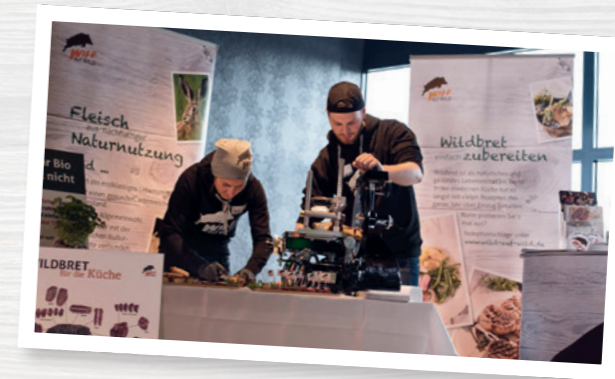
Suchen Sie sich Partner für Ihren Messeauftritt.

Da die Standgebühren oft etwas teurer sind, lohnt es sich, gegebenenfalls eine Kooperation zu starten – beispielsweise mit der lokalen Waldschule