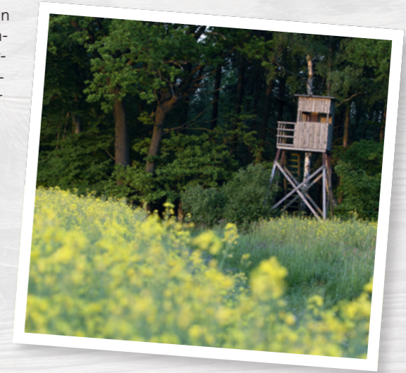
Jäger gewährleisten die Artenvielfalt.

andere Wildtiere haben ein unerschöpfliches Nahrungsangebot. Jäger dürfen übrigens nur in Notzeiten nach behördlicher Genehmigung füttern, etwa in Gebirgslagen. Das ist im Sinne des Tierschutzes: Bevor der Mensch die Tallagen besiedelte, konnten Wildtiere im Winter dorthin ausweichen und fanden genügend Nahrung. Jetzt blockieren Siedlungen und Verkehrswege das Winterquartier. Fütterungen in strengen Wintern sind also notwendig.