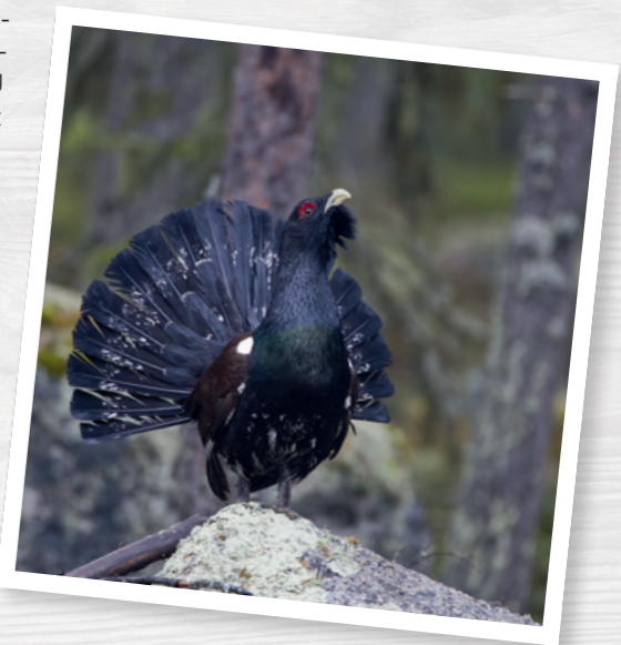
Auerwild wird durch anpassungsfähige räuberische Arten bedroht.

Totfanggeräte wie das sogenannte Eiabzugseisen für die Jagd auf Steinmarder dürfen nur in Verbindung mit einem geschlossenen Fangbunker mit Deckel verwendet werden. Der Zugang wird mit einer langen Röhre versehen, in die nur der Steinmarder hineinpasst. So ist ausgeschlossen, dass beispielsweise Hauskatzen in die Falle gelangen.