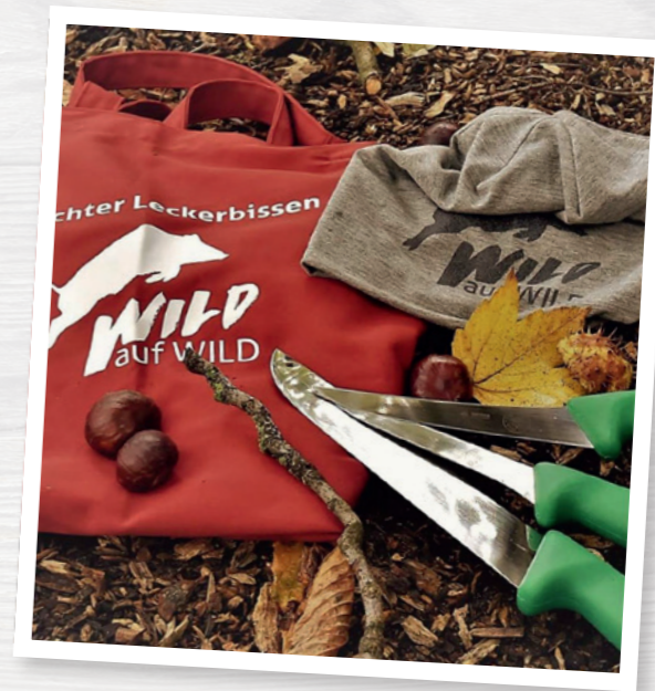
Die Werbemittel sorgen für einen tollen Auftritt.

Ein Bild sagt mehr als tausend Worte, nutzen Sie dieses Potenzial. Wichtig: Bei Bildern für Printme-