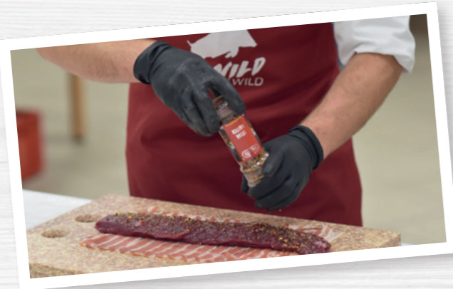
Tragen Sie bei der Zubereitung stets Handschuhe und Schürze.

Der Faktor Lebensmittelhygiene spielt überall eine äußerst wichtige Rolle, wo Sie in irgendeiner Form Wildbret sowie Getränke anbieten. Nach dem Motto