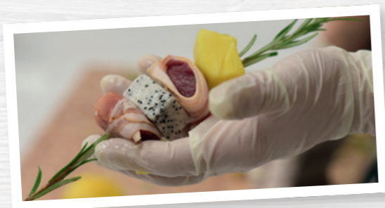
Hygiene wird großgeschrieben.

Wenn Sie Wildbret auf einer Veranstaltung zubereiten oder verkaufen wollen, sind Sie gesetzlich dazu verpflichtet, ein Gesundheitszeugnis vorzuweisen. Dazu müssen Sie an einer Schulung zur Lebensmittelhygiene („Belehrung im Sinne des Infektionsschutzgesetzes“) teilnehmen. Örtliche Gesundheitsämter bieten diese regelmäßig an. Eine solche Schulung dauert etwa zwei Stunden und kostet in der Regel um die 25 Euro.