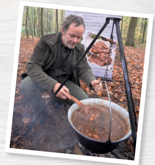
Das etwas andere Pressegespräch