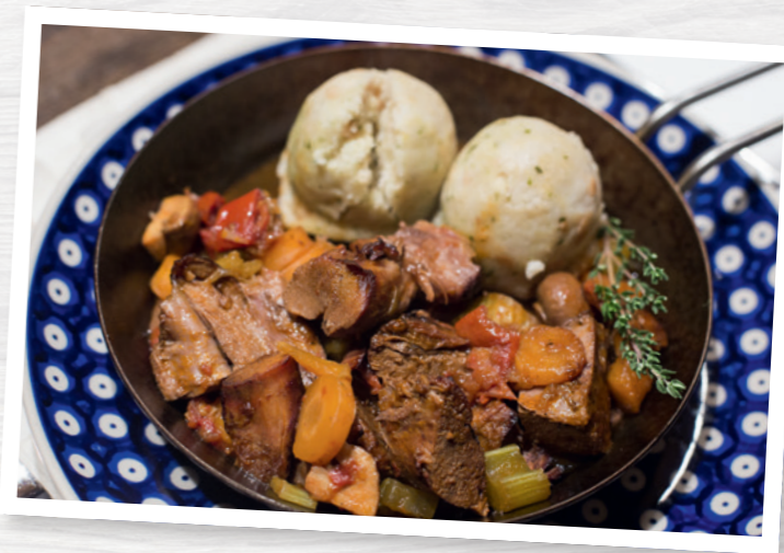
Frisches Wildbret schmeckt besonders gut.

Es darf nur die Strecke eines Jagdtages in Decke, Schwarte oder Federkleid abgegeben werden (so genannte kleine Menge). Das Wild darf in Decke, Schwarte oder Federkleid nur direkt an Endverbraucher (zum Beispiel andere Jäger, Treiber, Bekannte) oder den örtlichen Einzelhandel, der an Endverbraucher direkt abgibt (zum Beispiel Gaststätten, Metzgereien), weitergegeben werden. Die Direktvermarktung über den Einzelhandel darf nur im Umkreis von maximal 100 Kilometern um den Erlegungsort des Wildes oder den Wohnort des Jägers erfolgen.