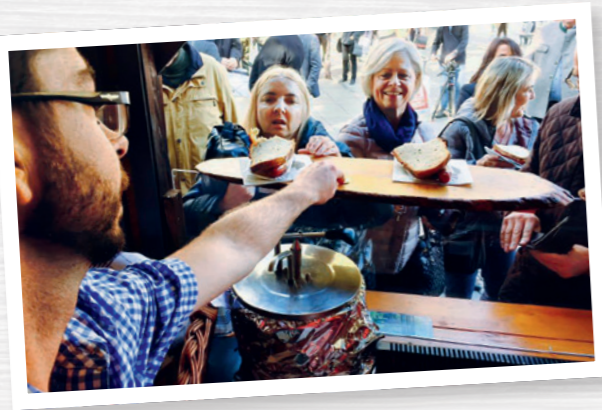
Gemütliche Marktbuden locken Besucher an.

Klären Sie vorab mit den Organisatoren des Weihnachtsmarktes, ob Sie Strom bekommen können (zum Beispiel für Wärmeplatten, um das Essen warm