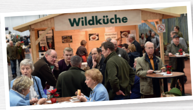
Der Stand sollte ein geschlossenes Dach haben.

Wenn Sie planen, Wildbret zur Verkostung oder zum Verkauf bereitzustellen, müssen Sie im Prinzip beachten, was Ihnen der gesunde Menschenverstand ohnehin sagt.