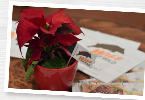
Blumentöpfe sind ein dekorativer Blickfang.

komplette Stände oder Biertischgarnituren zum Verleih an. Der Stand muss übrigens zum Schutz der Lebensmittel vor Umwelteinflüssen überdacht und an drei Seiten geschlossen sein sowie einen festen Boden haben. Wer einen Marktstand selbst organisieren muss, kann auf einen einfachen Garten- Pavillon mit Seitenteilen zurückgreifen. Biertische