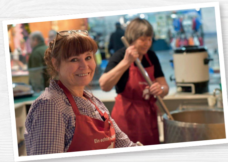
Freundlich und kompetent Auskunft geben