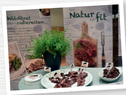
Hier möchte jeder am liebsten sofort zugreifen.