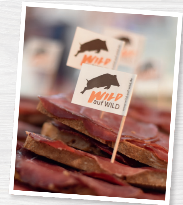
Das Befolgen aller hygienischen Auflagen garantiert einen appetitlichen Auftritt.

Für Revierpächter und Jäger, die Wildbret zur Abgabe und zum Verkauf auf Ihrer Veranstaltung zur Verfügung stellen, ist eine Wildkammer bzw. Kühlung verpflichtend.